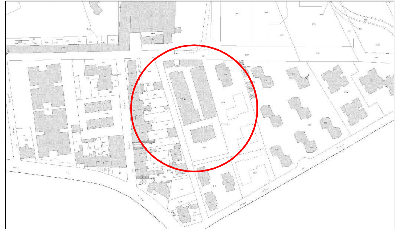
Estratto mappa catastale - foglio 22 - scala 1: 2.000