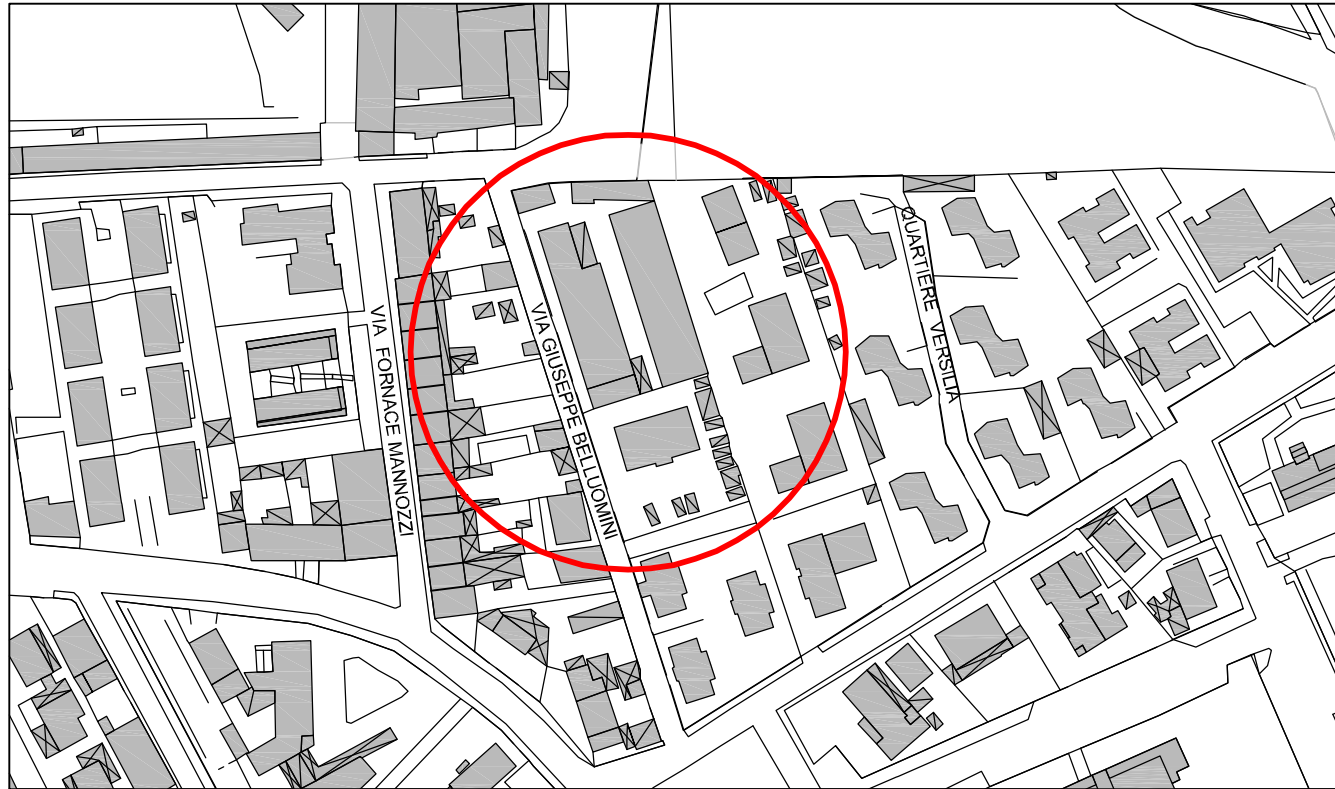
Estratto di aerofotogrammetrico - scala 1: 2.000